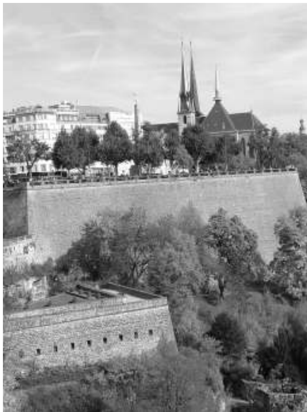
Die Stadt Luxemburg

Im Ersten wie im Zweiten Weltkrieg wurde Luxemburg trotz seines Status der immerwährenden Neutralität von deutschen Truppen besetzt. Der Versuch der deutschen Besatzungsmacht zwischen 1940 und 1944, Luxemburg gewaltsam ins Reich zu integrieren, hat ein tiefes Trauma bei den Luxemburgern hinterlassen. Kaum ein europäisches Land hat, gemessen an seiner Bevölkerungszahl, so stark unter dem Nationalsozialismus gelitten wie Luxemburg.