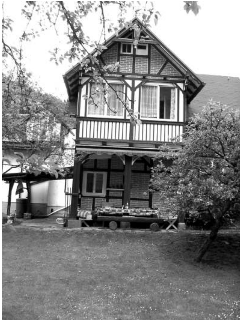
Unser temporäres Verbindungshaus